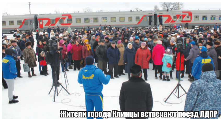
Жители города Клиницы встречают поезд ЛДПР

3 дня, с 5 по 7 декабря, поезд помощи ЛДПР курсировал по Брянской области. Первая остановка состоялась в Комаричах, далее через Брасово и Навлю поезд проследовал в Брянск, после чего в Сельцо и Климово. Конечной станцией в Брянской области стали Выгоничи.