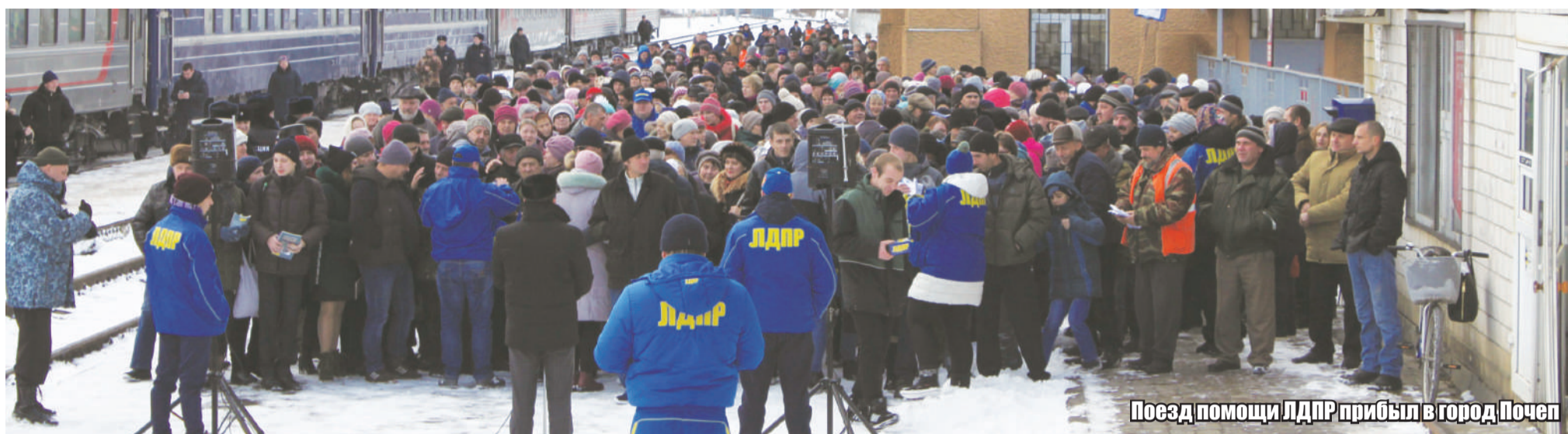
Поезд помощи ЛДПР прибыл в город Почеп

3 дня, с 5 по 7 декабря, поезд помощи ЛДПР курсировал по Брянской области. Первая остановка состоялась в Комаричах, далее через Брасово и Навлю поезд проследовал в Брянск, после чего в Сельцо и Климово. Конечной станцией в Брянской области стали Выгоничи.