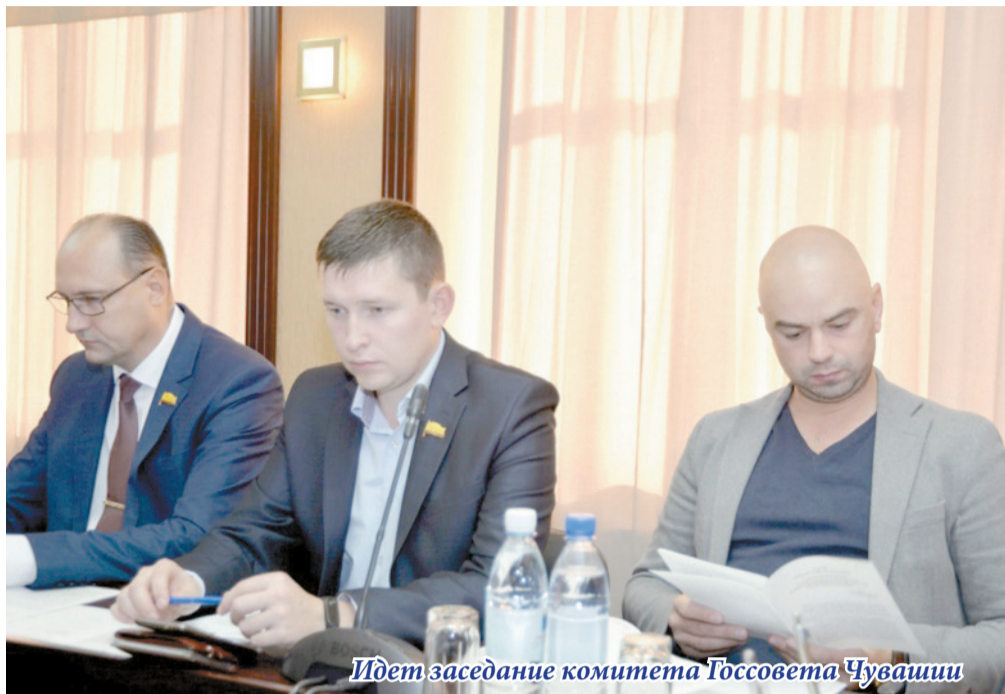
Идет заседание комитета Госсовета Чувашии

Позиция у фракции ЛДПР такова: какой бы ни был бюджет, пока его расходованием будут заниматься так, как сегодня, люди не увидят изменений к лучшему, качество их жизни не возрастет. Потому фракция ЛДПР в Госсовете Чувашии и не поддержала проект бюджета-2018.