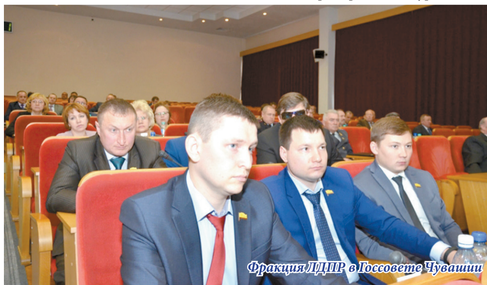
Фракция ЛДПР в Госсовете Чувашии

Активность здесь проявляют и муниципалитеты. Например, в Чебоксарах появились замечательные платные парковки. «Где эти парковки построили? Может, кто-то в них вложился, создав в центре города многоуровневый,