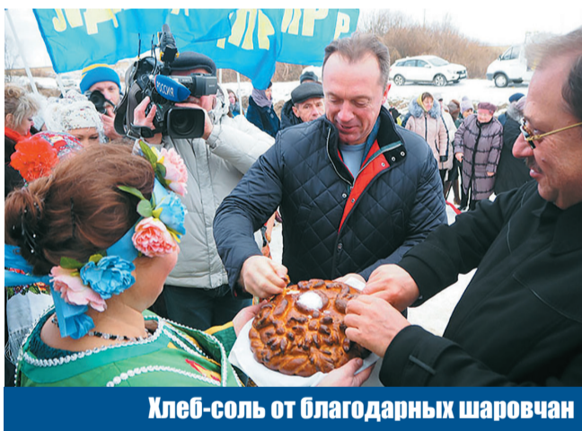
Хлеб-соль от благодарных шаровчан

Особо горжусь проектом по восстановлению ДК в селе Шарово Комаричского района. По весне там сгорел клуб вместе с реквизитом. Они просили одного – восстановить их очаг культуры. И представители местной исполнительной власти, и сами жители были готовы сделать всё, что в их силах, для возрождения клуба. Мы взяли на себя реконструкцию и отделку заброшенного здания бывшей столовой, администрация решила вопросы с отоплением, водой и электричеством. И вот 28 ноября при большом стечении народа клуб был открыт большим концертом самодеятельности, на котором я побывал. Это ценный опыт, действительно яркий, и важные воспоминания на всю жизнь.