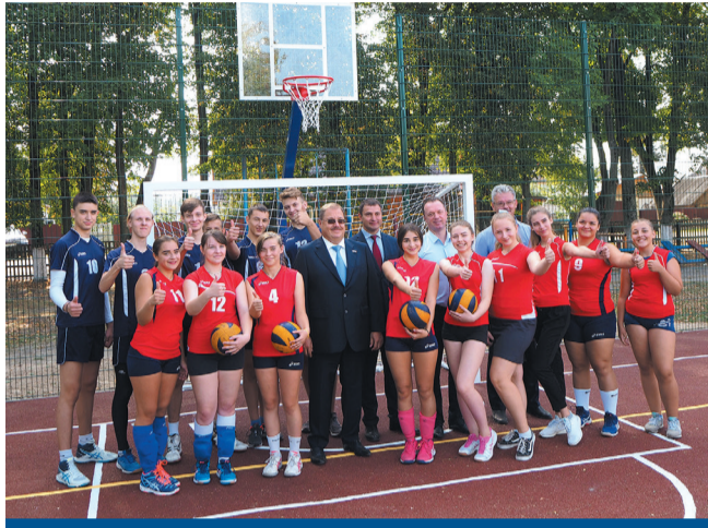
Открытие новой спортплощадки в Навле

На летних каникулах мы провели масштабные работы в школах и детсадах области. Были закуплены компьютерные классы, мебель для учебных аудиторий, спален,