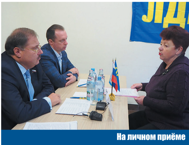
На личном приеме

Также в штабе регионального отделения ЛДПР работа ведется постоянно по всем поднятым на личном приеме вопросам. Работают юристы, направляются запросы и оказывается простая человеческая помощь.