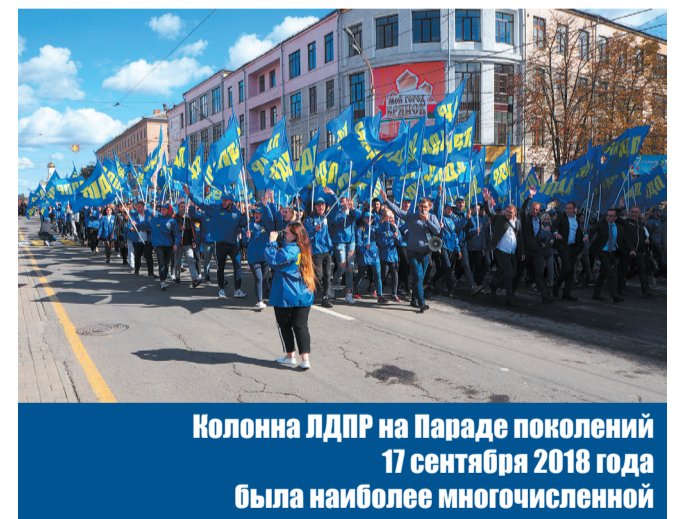
Колонна ЛДПР на Параде поколений 17 сентября 2018 года была наиболее многочисленной

– В Госдуме я продолжу свою законотворческую деятельность. Сейчас в работе законопроект о совершенствовании системы обращения с биологическими и медицинскими отходами, а также ряд других важных законопроектов. У нас большие планы и на развитие ЛДПР в Брянской области. 2019 год станет для региона годом больших выборов. Мы будем избираться в областную Думу, в депутаты муниципальных образований, в городской совет. Уже много желающих баллотироваться в 2019 году, мы ставим задачу, как и на прошедших выборах, заполнить все вакансии кандидатами от нашей партии.